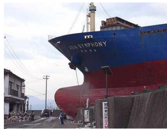
釜石港岸壁に津波で乗り上げた大型貨物船 (4,724トン、全長 100m)