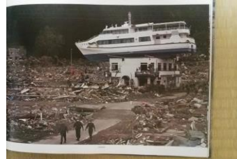
東日本大震災 8年前を繰り返さない