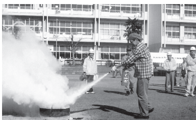
初期消火は大切です

したが日頃受信機が聞こえない方は、この際に市民相談室(22-3111)で調べてもらいましょう。