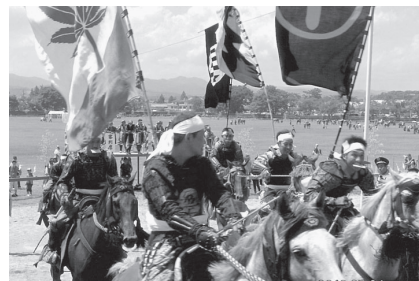
迫力満点な甲冑騎馬武者競馬

威風堂々、甲冑騎馬武者軍団の「お行列」、旗指し物をなびかせ、人馬一体で疾走する勇壮な「甲冑競馬」、花火で打ち上げられた御神旗を、数百騎の騎馬武者が勇猛果敢に奪い合う「御神旗争奪戦」など、一千有余年の歴史を持つ伝統文化行事を堪能した。