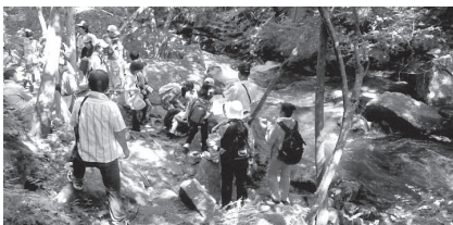
水しぶきを浴びながら！

青少年育成部主催の野外体験学習は、今年は8月8日貸切バスを利用して福島県の滝川溪谷へ遠征した。参加者は5・6年生男女15名、育成会5名、スタッフ10名、総勢30名。登山口を午前10時前に4班に分かれて元気に出発、次々