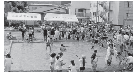
人気の水鉄砲海戦

水鉄砲、射的、忍者ゲームなどの子ども遊びや、風神太鼓、水木幼稚園児よさこいソーランや大みか小学校少女ハワイアンダンスなどのイベントも盛沢山、最後の子ども花火大会まで一日中、元気な子どもたちの歓声が響きました。