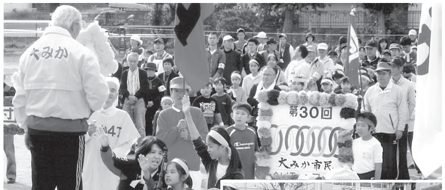
大声でがんばりまーす

「食欲の秋」ではパンを落とすほど元気に。「大みかスカイツリー」では高く積み上げたジュースの缶が制限時間内で崩れ、せっかくの努力が水の泡に。キャベツ、ダイコン、じゃがいも、人参など3kg以内を袋に詰める「買い物競争」と、お土産いっぱいの楽しい大会でした。水木保育園の荒馬踊り・水木わかば幼稚園のヒップホップダンス・大みか風神太鼓連の風神太鼓・子どもたちのアトラクションに、みんな笑顔で拍手を送って