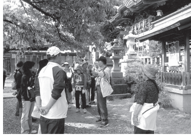
真剣に聞き入る参加者

日立の魅力を再発見しようと、毎年秋の季節に「再発見ウォーク」がそれぞれの学区ごとに日立市コミュニティ推進会の主催により開催されて今年で12回目になります。今年度は市内21か所をめぐり、そのひとつとして大みか学区コミュニティ推進会再発見ウォーク実行委員会により、11月7日(日)「阿武隈山地の最南端・大甕を歩こう!」が暖かい日和の中、17名の参加で行われました。