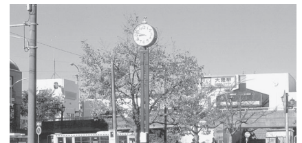
ピッタリの時を刻んでいます

駅前花壇のところに立っている時計台は、劣化のため止まってしまいました。このため7月に新しい時計を取り付けました。太陽電池で駆動するエコタイプです。