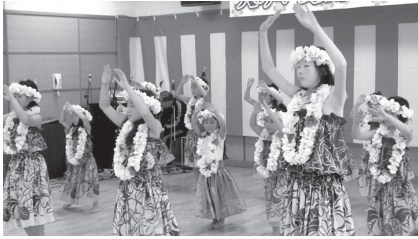
かわいい子どもたちのフラダンス