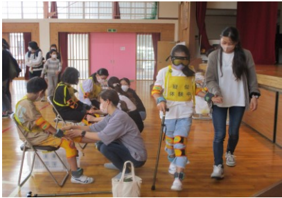
高齢者疑似体験の様子と使う道具

10月11日（火）諏訪小学校5年生の親子学習会で高齢者福祉体験を諏訪小学校体育館で行いました。3チームに分かれて、車いす体験、視覚障害者の体験、高齢者疑似体験を行いました。今回は、初めて親子での開催でしたが、それぞれ注意を促す言葉かけを考えながら伝えてとてもいい体験ができたようでした。