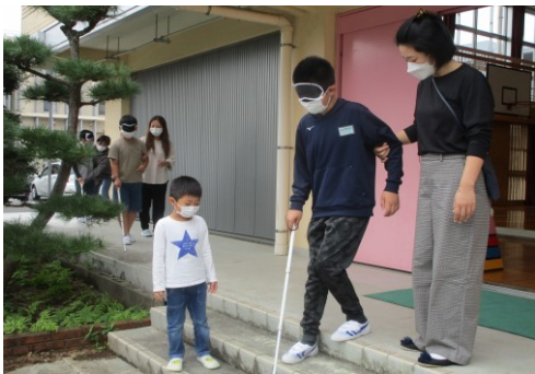
視覚障害者体験の様子と使う道具