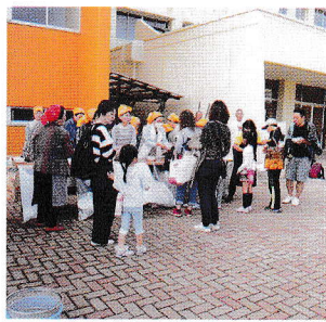
お腹が空きましたハイどうぞ(豚汁)