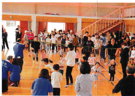
ボク手で取ってもいいよ(パン食い競争)