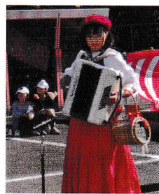
「みさびー」さん登場