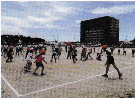
ドッジボール大会