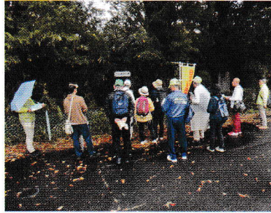
念 仏 橋