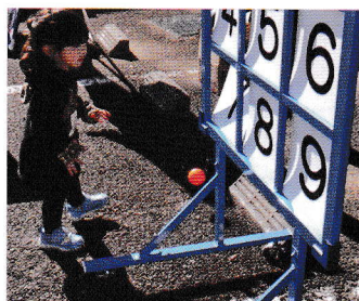
しっかり7番当てたよ!