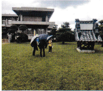
要害クラブの鬼瓦