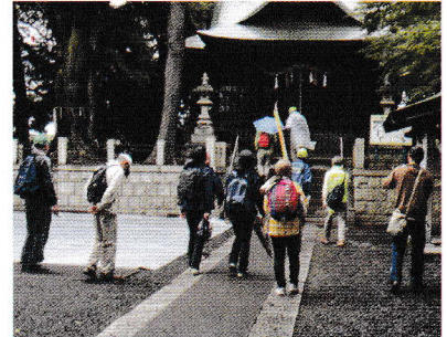
八 幡 神 社