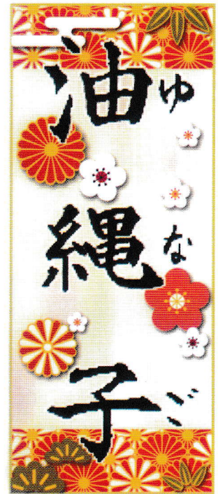
チカラ合わせて元気よく！