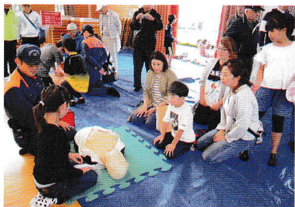
よく聴いて覚えましょう(心臓マッサージ)