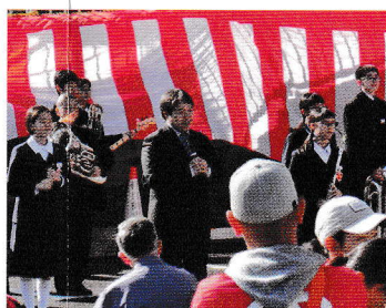
多賀中吹奏楽部の皆さん