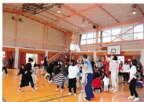
よくねらいましょう(玉入れ)