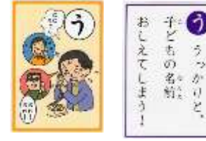
学区消費生活サポーター

*気をつけましょう!! 相談は消費生活センターへ TEL.0294-26-0069