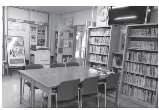
交流センターロビーは図書コーナーも設置

塙山交流センターも「まちなかオアシス」です。バスの待ち時間、散歩の途中などに気軽にお