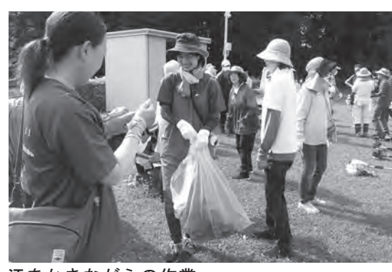
汗をかきながらの作業

問合せ 塙山交流センター TEL 三四一五四〇四 修理公園の除草 大勢で汗を流す 七月二日(日)、午前八時から修理公園の除草作業を行いました。当会の各局、まちづくり応援隊、おとこ塾等のメンバー三十四名が、刈り払い機や芝刈り機で作業、鎌でフェンスに巻き付いたヤブカラシの除去などに汗を流しました。