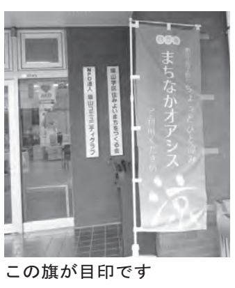
この旗が目印です

暑さをしのぐ一時休憩所として市役所・支所・交流センターなどに「まちなかオアシス」が設置されました。