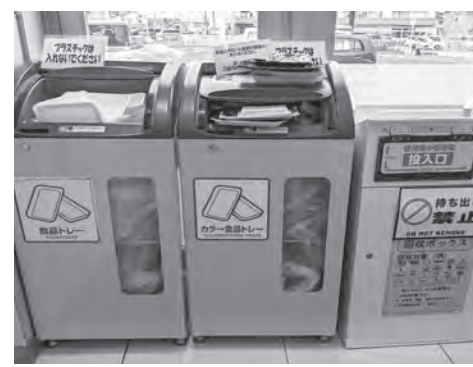
マルトの回収コーナー

マルト塙山店でも資源回収コーナー設置 ビン、カン、牛乳パック、食品トレー、小型家電などの回収コーナーが設けられています。きれいに洗って回収場所に届けましょう。 買い物はエコバッグを持参、ポリ袋一枚節約することで二〇グラ