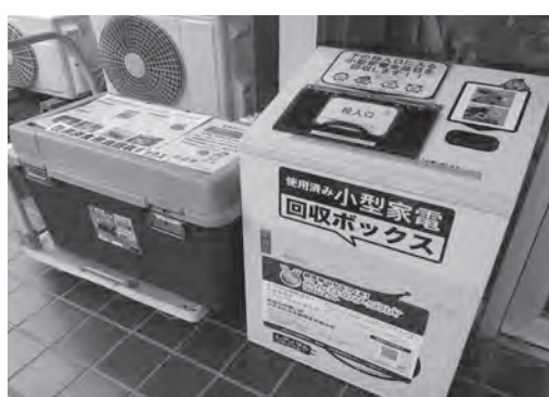
玄関には小型家電と廃油回収ボックス

ペットボトル、板紙、廃油、小型家電の回収を行っています。ごみにしないで回収箱に入れてください。