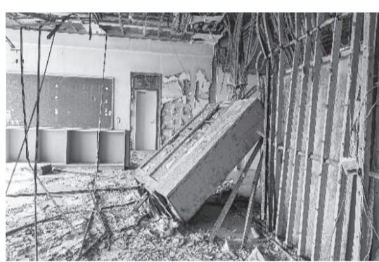
津波が直撃した教室

そのような状況で児童、教職員の的確な判断と速やかな行動によって全員が無事に避難することができた奇跡の学校として、津波の脅威と震災風化をさせないために残された学び舎でした。