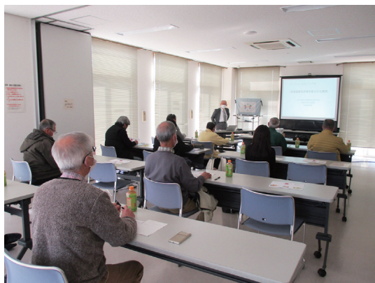
熱心に聞き入る受講生の皆さん

能廃棄物処理の問題が残る。一方、私達が電気自動車に乗換えることが如何に有効なことか納得できた。54 枚の図やグラフと動画(平均気温 2 度上昇の世界を描く)を用いた講義で、地球温暖化問題が今日の身近で重要な問題であることを参加者一同再認識させられた。