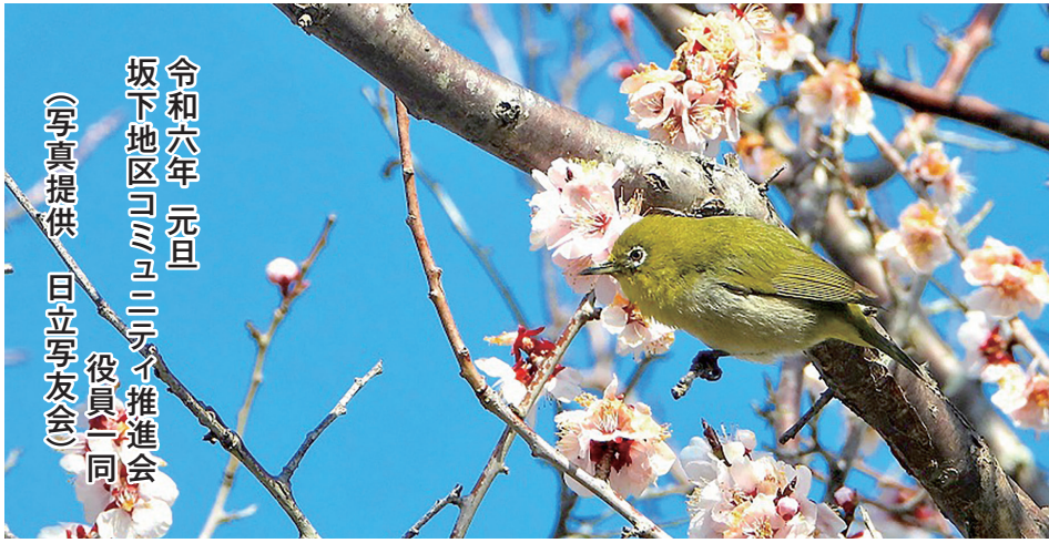
令和六年 元旦 坂下地区コミュニティ推進会 役員一同