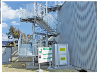
交流センター避難階段