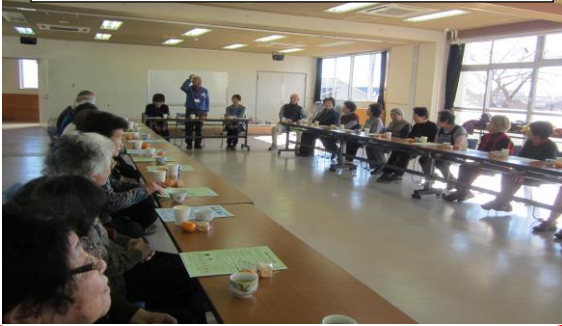
にこにこクラブ新年会風景

是非、にこにこクラブへお越しください。 対象は、介護保険を利用していない65歳以上の方。