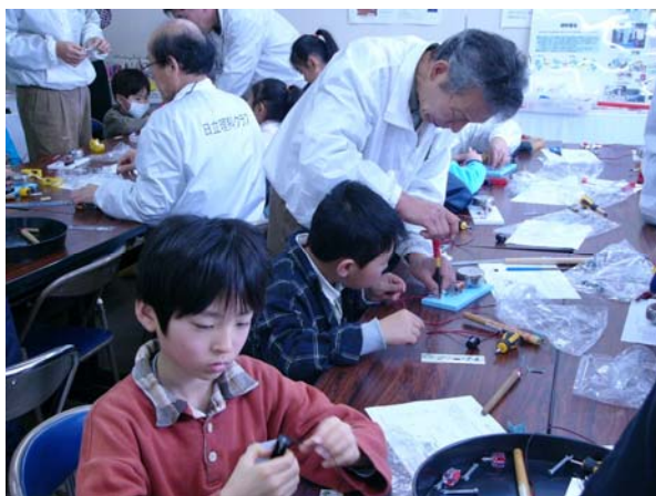
電磁コイル巻線風景

電磁石を応用したベル（電鈴）づくり。 全員が上手にベルづくりができ、自分で作ったベルの音に歓声があがる。 ベルのなる原理を理解してもらい、モノづくりの楽しさを体験してもらった。