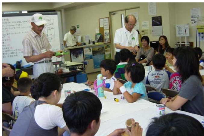
熱心に工作手順の説明を聞く

電磁石を応用したベル（電鈴）づくり。 全員が上手にコイル巻線もでき、ベルを完成させた。ベルの音に歓声と笑顔。 ベルのなる原理を理解してもらい、モノづくりの楽しさを体験してもらった。