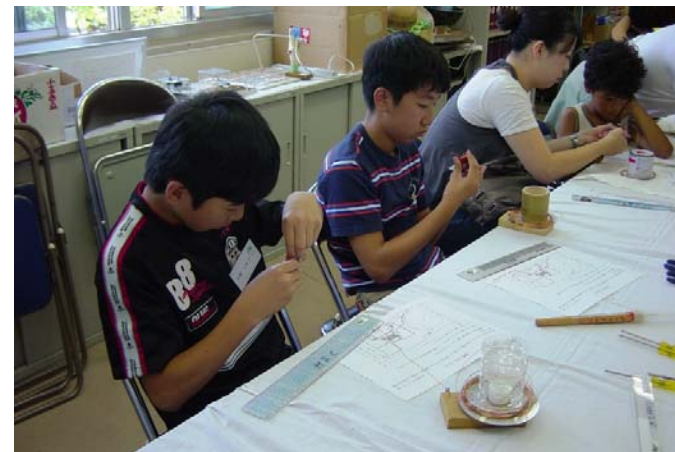
電磁コイル巻線風景