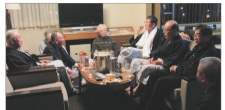
深夜まで続いた二次会