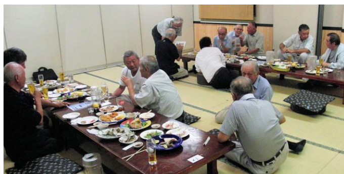
お開き間近で、ばらけていますが、それぞれに話が弾む

会はなごやかに続き、思い出話から、これからの会の進め方など、いろいろな話の花が咲き、午後7時過ぎお迎えのバスが来て散会となりました。ご出席の皆さんありがとうございました。