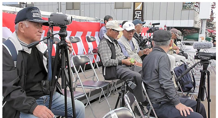
夕方になり空いた来賓席で会員もひと休み