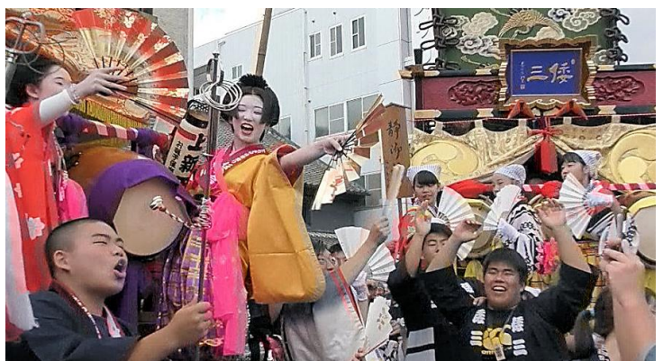
山車同士がお囃子を競い合う「ぶっつけ」が盛り上がる

今回も楽しい撮影会ができ、ありがとうございました。発表会は1月例会を予定しています。