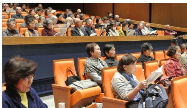
今回の客席は女性の方が多かったようです。