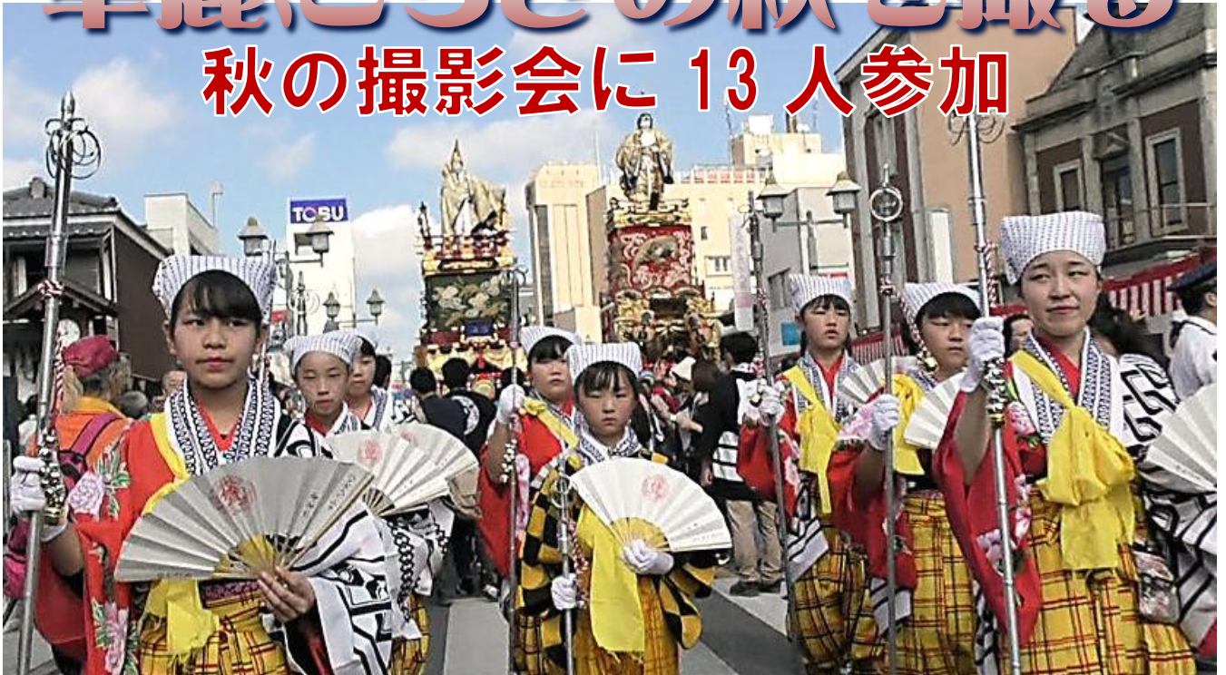
絢爛豪華な6台の山車が交互に町中を巡行する

11月10日(土)、朝7時、秋の撮影会のために栃木市を目指して、バスは出発しました。途中参加者を乗せて今回の参加者は13人となりました。