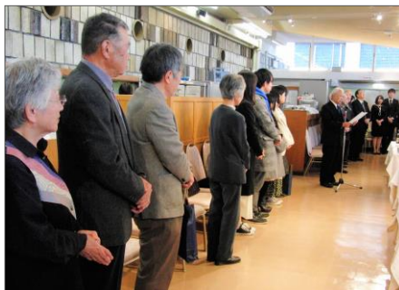
記念パーティで開式あいさつ