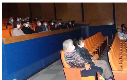
客席はまばらでも皆さん熱心に画面に見入っていました