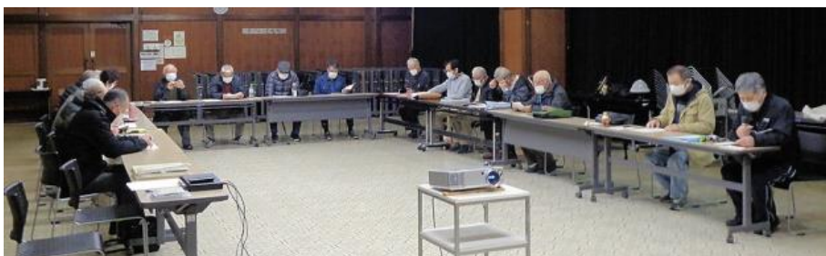
新年初例会は、18人が出席してスタートしました

ナのもと、まだまだ難しい年になりそうですが、会員皆で協力しあって、撮影会なども実施し