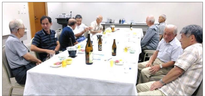
宴はお開き近くなっても話は尽きず…

5時30分まで、しばし時間をつぶして開宴。久しぶりの懇親会に、ふだんの例会では出ない話で、和やかな時を過ごしました。7時30分に散会、それぞれBRTなどを利用して帰宅しました。