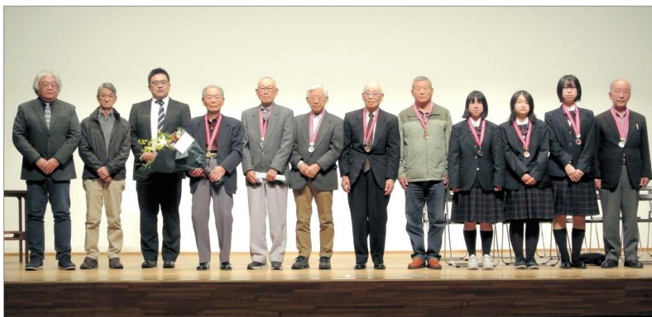
記念のメダルを胸に掛けステージに並んだ受賞者と審査員の皆さん

内容的にも、長期間のドキュメント作品、ホームビデオ、アニメーションと多岐にわたり楽しめる発表会でした。