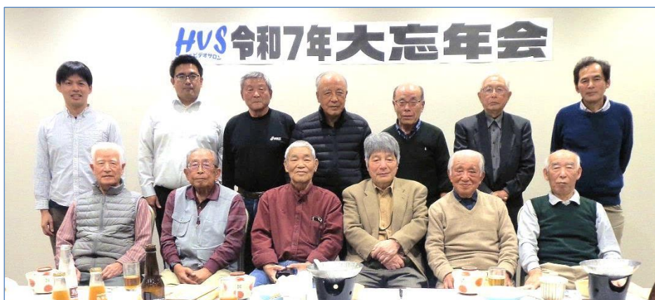
参加者数は減ったけれど、今年も和やかな顔がそろいました