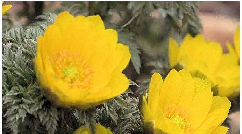
「春よ来い」から福寿草のワンカット