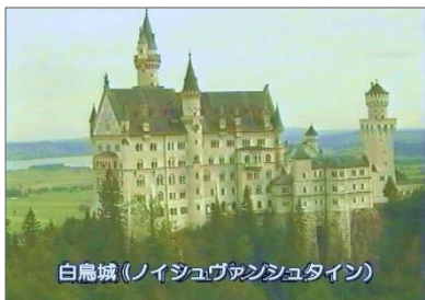
白鳥城(ノイシュヴァンシュタイン)

《作者コメント》 11日目はミュンヘンから白鳥城へ行き見物し、スイスのルツェルンに到着しました。