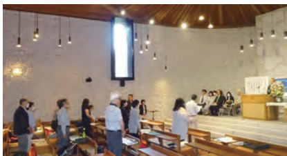
期待を胸に開講式

共施設などを会場に、一般教養、まちづくり、ボランティア活動、自主企画など 26 のカリキュラムを学びます。また、受講者が一つのクラスとして活動することで、仲間としての絆もできます。