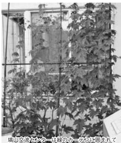
塙山交流センターは緑のカーテンに囲まれて

日立化成グループではこれまで多くの小・中学校に苗を贈り、グリーンカーテン運動の拡大を図ってきましたが、さらに地域にも広げたいとの意向を持っていました。