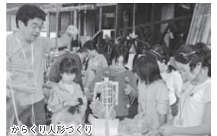
からくり人形づくり

http://www.net1.jway.ne.jp/miyatasuisinkai/