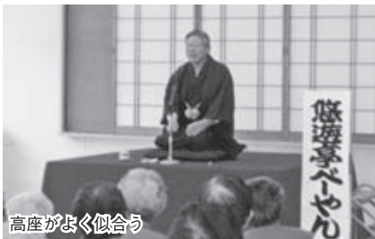
高座がよく似合う