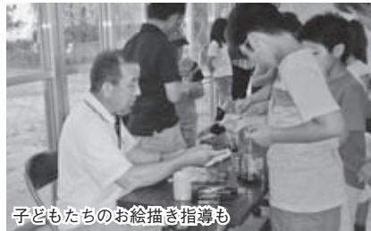
子どもたちのお絵描き指導も

合の場所の改善などに汗を流し、地域ではコミュニティの事務局の一員として活動を支援しています。