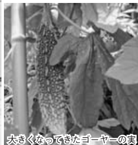
大きくなってきたゴーヤーの実

一方、塙山学区でも今年度はグリーンカーテン運動を展開しようと計画しており、今回の連携事業となったものです。