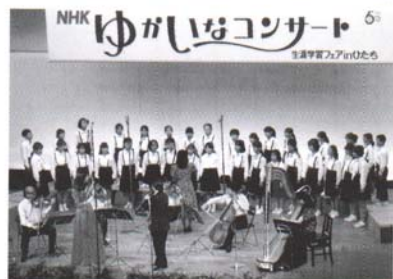
生涯学習フェア in 日立 (1989年)