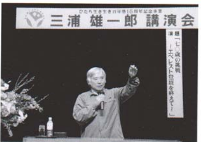
百年塾15周年記念事業・三浦雄一郎講演会 (2004年)