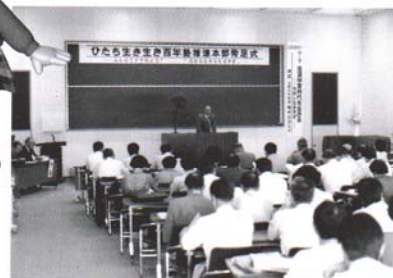
日立生き生き百年塾推進本部 発足式 (1988年)