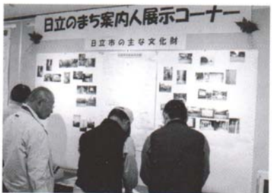
日立のまち案内人 (2003年)