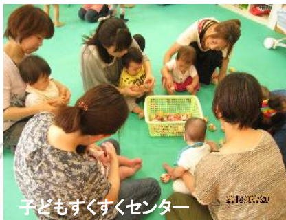
子どもすくすくセンター

共にはぐくむまちをつくるため、市民、地域、学校、企業、行政が連携していきます。男女共同参画社会の実現、青少年育成や子育てなど、みんなで共に育て合う環境を整えます。