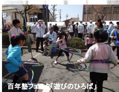
百年塾フェスタ「遊びのひろば」

障害者や高齢者が健康で安心して暮らせる地域福祉の充実。エコカーテンなど環境負荷の低減や、自然の尊さを学び、自然の脅威とその対応を次世代へ語り継ぎ、人や環境にやさしいまちづくりをしています。