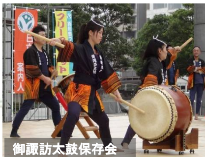
御諏訪太鼓保存会

市民が地域の産業を応援することで、まちが活気づきます。祭りや各種イベントを通して若者の活躍の場をつくり、若い人たちが楽しみ、参画できるまちをつくります。明るく元気な市民が増えることを目指します。