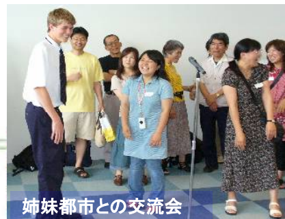
姉妹都市との交流会

バーミングハム、タウランガなどの姉妹都市と交換留学や情報交換をします。ホームステイ、日本語クラスなど国際相互理解の支援や、ワールドキャラバンによる情報の発信など、日立市の国際化の活動を応援しています。