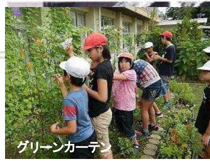
グリーンカーテン

美しい・クリーンな魅力あるまちをつくるため、個人、ボランティア団体、地域、学校、企業、行政などが一緒になってごみの減量、地域清掃、里山の緑や川、海を守る運動、花いっぱいなどの活動を行っています。