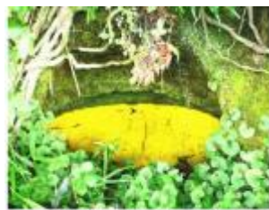
公園内の水穴で輝くヒカリモ (1)

国道6号バイパスの北端部にある東滑川公園が2019年7月に海を感じながら遊べる公園として、リニューアルオープンしました。大型遊具が設置され、芝生が張られ芝滑りができる様になりました。写真撮影用フレーム板も設置され、「インスタ映え」が期待できます。子ども連れには、「身近な場所に楽しめる公園が出来て良かった」と喜ばれています。愛称の「東滑川ヒカリモ公園」は応募189件の中から、東滑川町の佐久間さんの作が選ばれました。緑地内に点在する洞窟に神秘的な輝きを放つヒカリモが生息する事がヒントになったそうです。緑地再整備は市道を挟んだ市公設卸売市場跡地の大型商業施設整備に伴って、店舗の屋上庭園と緑地側と歩道橋で連結し、のんびり散歩できる構想の一環です。遊歩道は太田尻海岸まで、つながっていて、海岸と公園とヒカリモが一体化し、時間や季節によっての景観が楽しめます。これから大型商業施設につながり進化していく東滑川ヒカリモ公園にぜひ、足を運んでみて下さい。きっと地元のすばらしさを実感できることでしょう。