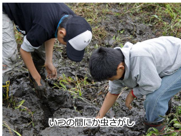
いつの間にか虫さがし