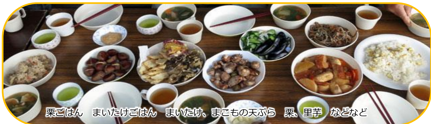
栗ごはん まいたけごはん まいたけ、まこもの天ぷら 栗、里芋 などなど