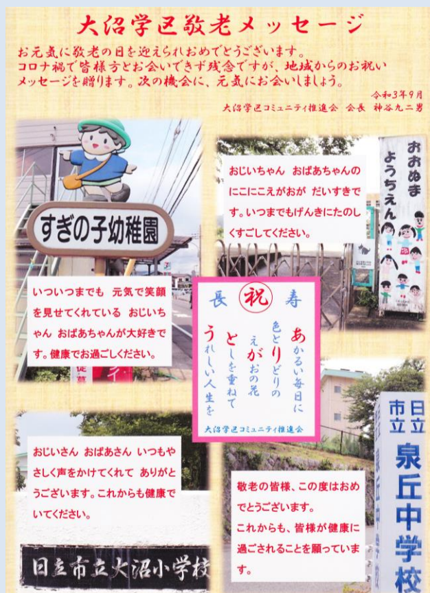
地域のメッセージカード

地域のメッセージカードは学区内の幼稚園・小学校・中学校から敬老者にいただいた心温まるメッセージを写真とともに編集し作成したものです。