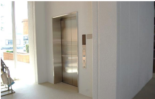
●エレベーター設置