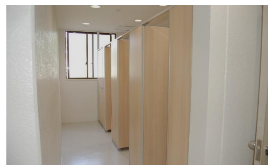
●体育館トイレ男女