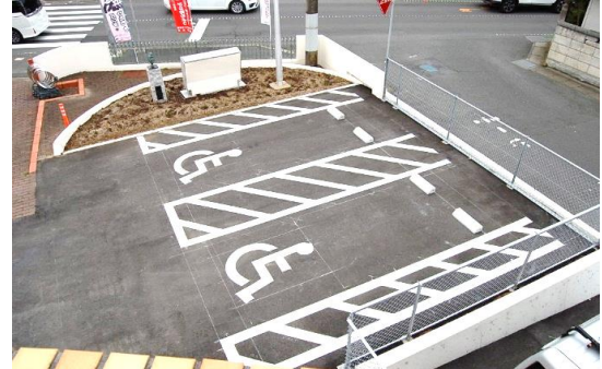
●障がい者用駐車場2台