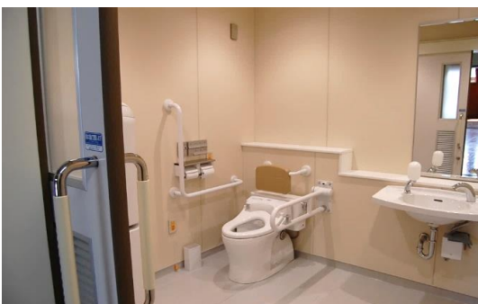
●体育館のみんなのトイレ