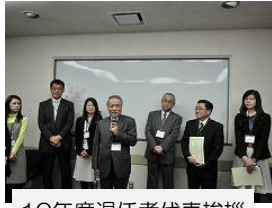
10年度退任者代表挨拶