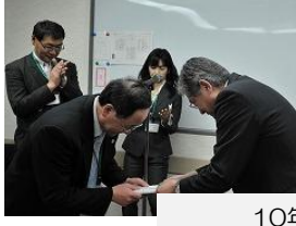
10年度地区事務局へ記念品贈呈