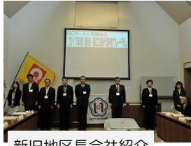
新旧地区長会社紹介