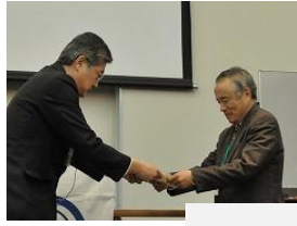
10年度退任者へ感謝状贈呈