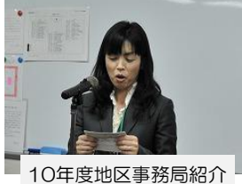
10年度地区事務局紹介