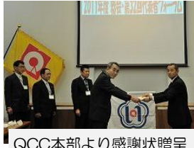
QCC本部より感謝状贈呈