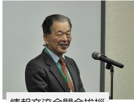
情報交流会開会挨拶