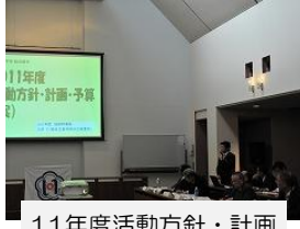
11年度活動方針・計画