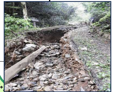
上から2番、3番橋 間の状況