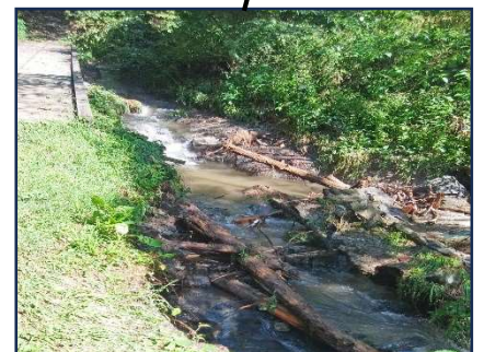
木道橋下の流れ 水流が変わり、木材集積