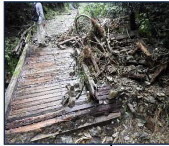
上流から2番目の橋状況