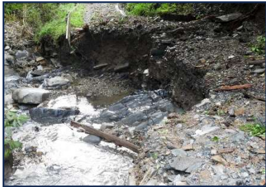
トンネル橋間道路流出