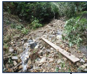
ビトフ手前の状況