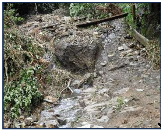
風の谷～ビトフ中間

(令和5年9月8,9日、気圧：1,000hPa、雨量100mm/時、270mm/日)