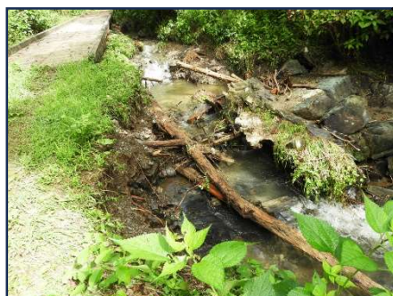
木道橋付近の流路変更 水流が橋寄りになる