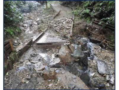
最上流の橋の状況