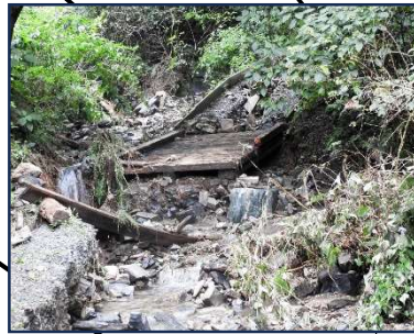
トンネルから最初の橋手前 道路が削れ取られている