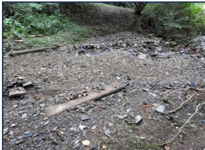
「おおみね」渡し橋状況 橋げた迄土砂堆積