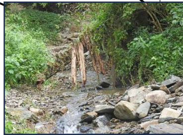
ひねり沢からジグザグ 渡し場所、女、子供無理