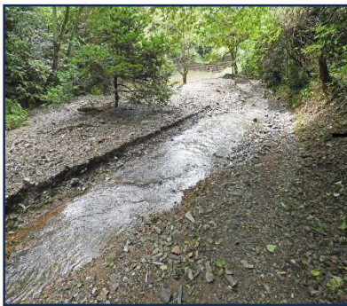
砂防ダム上流の状況 流路が変わっている