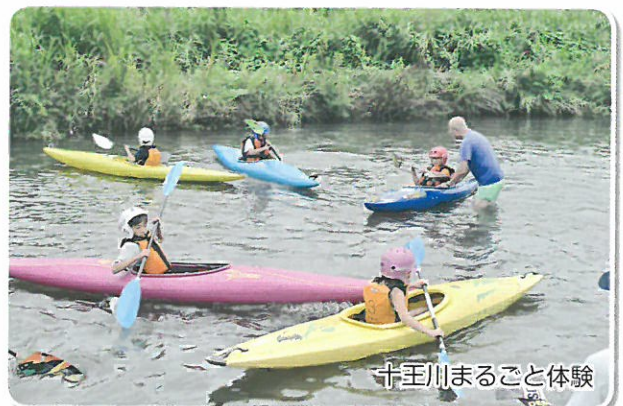
十王川まるごと体験