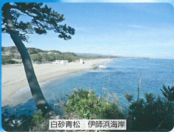
白砂青松 伊師浜海岸