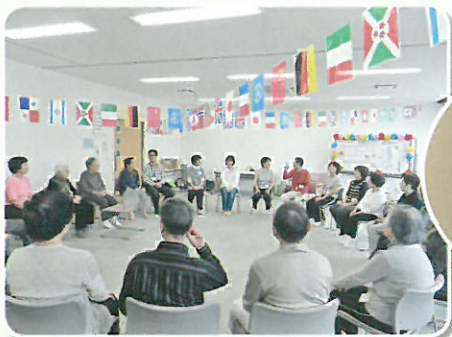
ふれあい健康クラブ (福祉事業委員会)