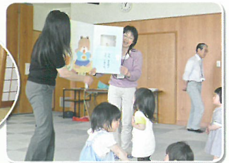
おもちゃライブラリー (福祉事業委員会)