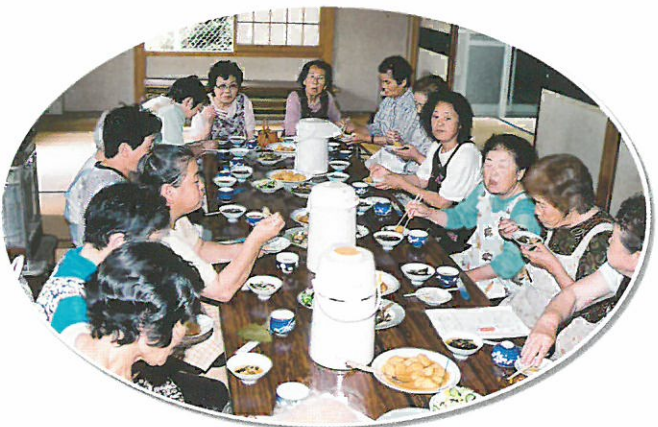
ふれあいサロンへの食生活指導