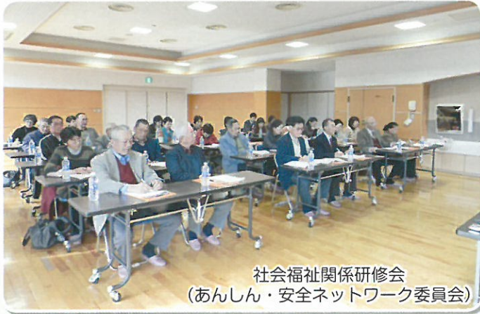
社会福祉関係研修会 (あんしん・安全ネットワーク委員会)