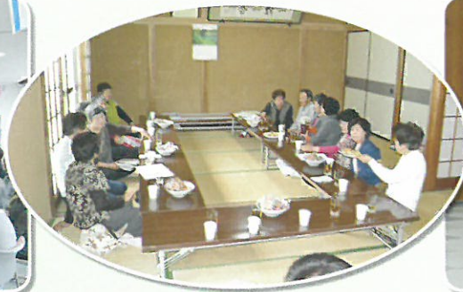
ふれあいサロン (福祉部事務局)