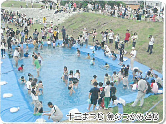
十王まつり 魚のつかみどり