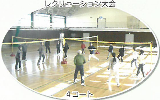
レクリエーション大会