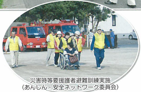
災害時等要援護者避難訓練実施 (あんしん・安全ネットワーク委員会)