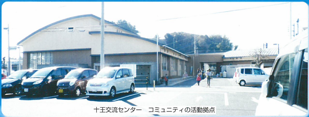
十王交流センター コミュニティの活動拠点