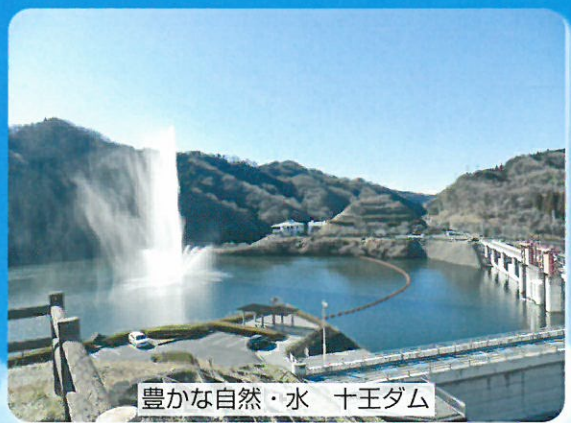
豊かな自然・水 十王ダム