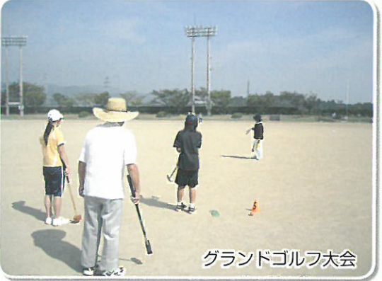
グランドゴルフ大会