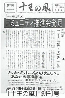
コミュニティ広報紙「十王の風」