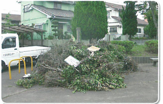
町をきれいにする運動