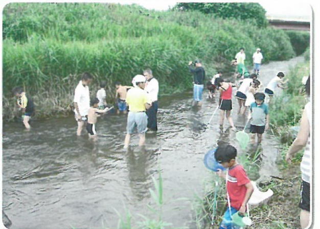
十王川まるごと体験