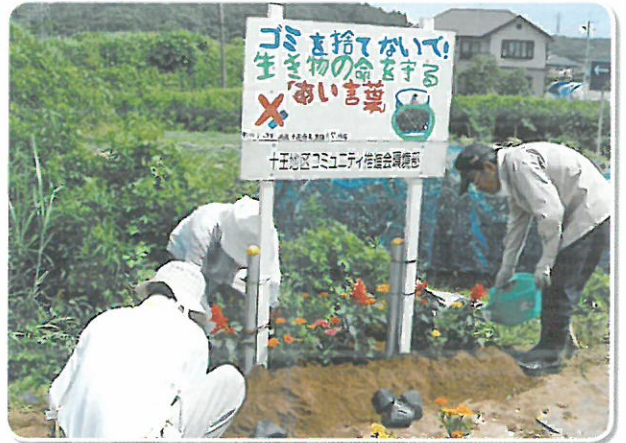
花いっぱい運動 クリーンな空間にさわやかな美を