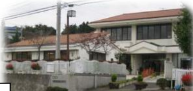
滑川交流センター