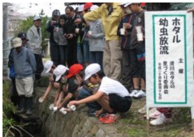
ホタルの里親と滑川小ホタル少年団