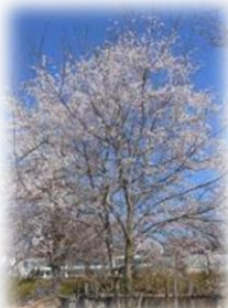
淡墨桜 (国指定天然記念物)