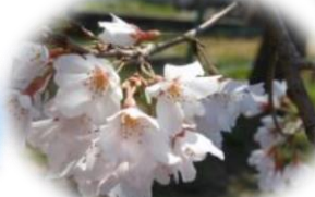
塩竈桜 (国指定天然記念物)